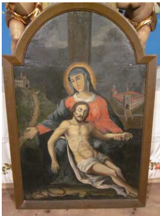
bývalý oltářní obraz „Pietà“ z kaple na Melišku