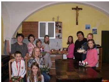
Foto z vyrábění adventních věnců dětmi ve škole a na faře ve středu 23.11