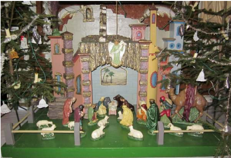
Jesličky v kostele sv. Jana Křtitele v Mnichu