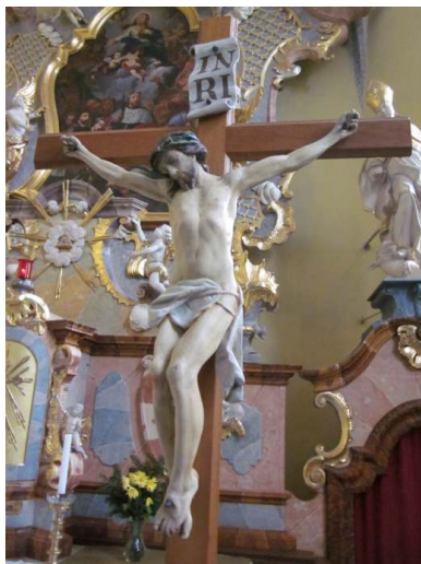
Současný kříž před oltářem v Kamenici nad Lipou

Kristův kříž je nejvyšším důkazem milosrdenství a lásky Boha k nám: Ježíš nás miloval „až do krajnosti“ (Jan 13,1), to znamená nejenom do posledního okamžiku svého pozemského života, nýbrž do krajnosti lásky. Ve stvoření nám Otec podal důkaz svojí nezměrné lásky tím, že nám dal život; v utrpení a smrti svého Syna nám dal důkaz nad všechny důkazy: přišel trpět a zemřít pro nás. Tak obrovské je milosrdenství Boha: miluje nás a odpouští nám. Bůh odpouští všechno a vždycky.