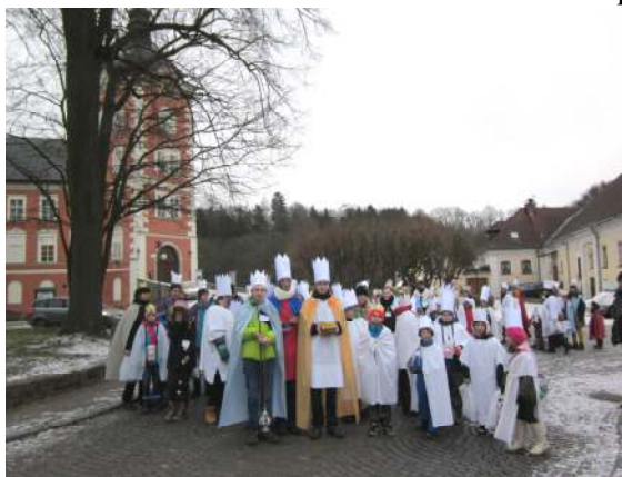
Průvod koledníků přes náměstí ke kostelu

vykoledovalo 182.466,- Kč (o 19.944,- Kč více než v roce 2015). Výsledek je velmi potěšující a do Farní charity v Kamenici se vrátí 65% - 118.603,- Kč, které budou podle schváleného záměru použity ve prospěch pečovatelské služby a na pomoc osobám v nepříznivé životní situaci v naší oblasti.