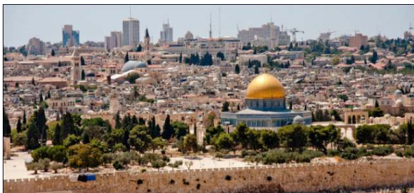
Celkový pohled na Jeruzalém

a Pole pastýřů s jeskyní upravenou pro církevní obřady. Zbývající dva dny jsou vyhrazeny pro Jeruzalém. Ráno se začíná na Olivové hoře, potom přejíždíme ke Starému městu a procházíme Křížovou cestu k nejposvátnějšímu místu – Chrámu Božího hrobu. Uvnitř jeho zdí je vrch Golgota, na kterém byl Ježíš ukřižován, a také jeskyně jeho uložení do hrobu a zmrtvýchvstání. Potom navštěvujeme na hoře Sión kostel zesnutí P. Marie (Dormitio) a místo poslední večeře Páně. Odpoledne při cestě