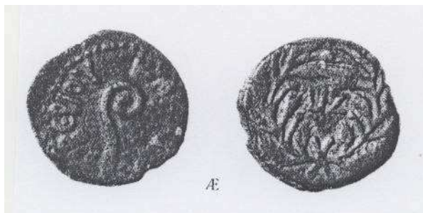
Mince Pontia Piláta

Ještě k článkům o Pilátovi na straně 6 - 9. Zatímco ostatní prefekti v Judsku respektovali při volbě motivů na mincích náboženské cítění Židů, dal Pilát mince ozdobil sakrálním úředním označením augurů, tvořících jedno z římských kněžských kolegií. Na jedné straně mince to byla zakřivená hůl, úřední značení nejvyššího augora a jméno císaře Tiberia. Na druhé straně letopočet - 17. rok vlády ve vavřínovém věnci, tj. rok 30/31 po Kr.